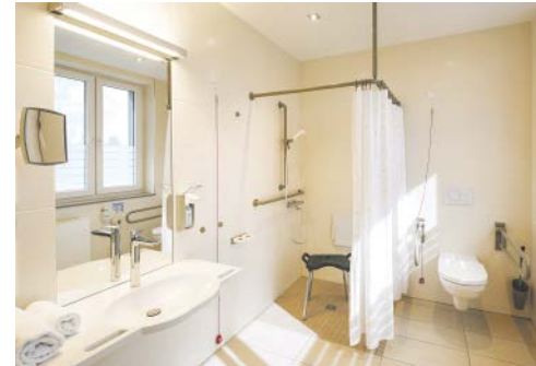
Entspannt, hell und geräumig erfreut das Bad auch die Pflegenden durch optimale Arbeitsprozesse

ohne ihren Physiotherapeuten. Die Healing Gallery zeigt darüber hinaus inspirierende Naturimages wie Gräser und Blätter als Close-up und ergänzt den grünen Ausblick in die Umgebung, wogegen in Kliniken gerne gesehene medizinische Illustrationen absolut ta-