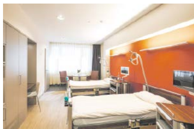
Das bestens ausgestattete Patientenzimmer wird von warmer Atmosphäre geprägt.

Sämtliche Patientenzimmer, 1-Bett und 2-Bett, sind einheitlich gestaltet und werden von einer beeindruckend warmen Atmosphäre die für Wohlgefühl und Aufenthaltsqualität sorgt, geprägt. Hochwertige Zebranoholzoptik, edle Taupetöne, cognacfarbenes Leder wird von geerdeten roten Akzenten im Raum ergänzt. Die Ausstattung vom gepolsterten Sessel bis hin zum persönlichen Schreibtisch erlaubt auch außerhalb des Bettes adäquate Abwechslung, den Tag außerhalb des Krankenbettes zu verbringen. Gutes Licht sorgt dabei für Wohlbefinden und kann komfortabel gesteuert werden. Geräumige und helle Tageslichtbäder bieten Annehmlichkeiten für die Patienten, wobei das Personal die klare Ausstattung, die Funktionalität und reibungslose Arbeitsprozesse erlaubt, schätzt. Klinikspezifische Funktionalität bildet die unverzichtbare Basis, so wurde z. B. bewusst zugunsten optimierter Arbeitsprozesse, Bewegungsabläufe und Hygiene auf die als hochwertiger Standard geltende Duschverglasung