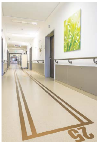
Die in den Flur integrierte Trainingsstrecke für erfolgreiche Rapid Recovery