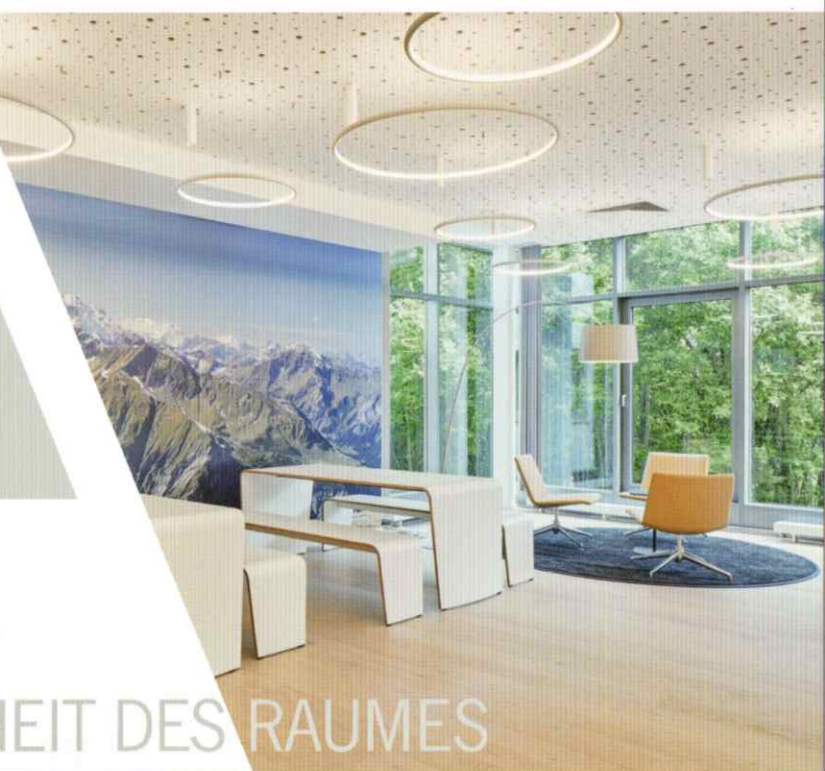
Bild unten: dhpg, Steuerberater- und Wirtschaftsprüfer- kanzlei, Gummersbach | Innenarchitektur: 100% interior, Köln

Bild oben: Open Space im Basement der Köln Arcaden, Köln | Innenarchitektur: kplus konzept GmbH, Düsseldorf