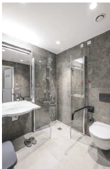
Das Badezimmer mit Steinoptik, sowohl hinsichtlich Wasser und Sauberkeit als auch Entspannung den passenden Rahmen bietet.

sorgfältig ausgewählten Materialien laden den Raum atmosphärisch positiv auf, sodass sich unmittelbar ein Gefühl des Wohlfühlens einstellt. Subtile Texturen, Metallics, akzentuieren die ausgewählt zurückhaltende Farbgebung in unauffällig gedeckter Tönung, lediglich akzentuierendes Orange. Das ruhige Farbkonzept orientiert sich an der Natur durch seine ausgewogene Balance, die klaren und regelmäßigen Ornamente des hochwert-