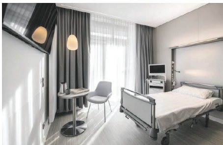
Wahlleistungspatientenzimmer in der Uniklinik Köln

Das überzeugende Gesamtkonzept aus Atmosphäre und Funktionalität schafft daher nicht nur ein Heilung unterstützendes Healing Environment, sondern auch eine Umgebung mit unaufdringlichem Charakter. Die Material- und Formensprache ist dezent elegant-modern und wohldisort extravagant, ohne aufdringlich zu sein. Seien es minimalistische Leuchten, Versorgungsleisten die revolutionär in Bronzefarbe realisiert wurden, der Manufakturcharakter der Fliesen oder attraktiver Dekorations-elemente. Die gewählten Farbnancen und