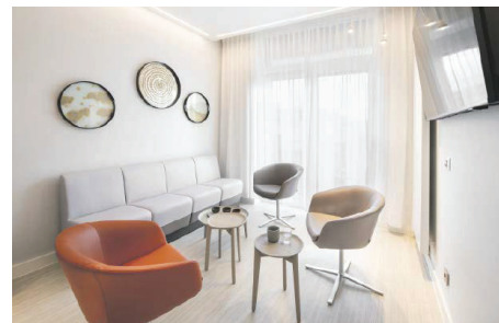
Die Lounge bietet alles zum Glücklichein.

Nasszelle pass! Hier ist ein Bad entstanden, das durch seinen Touch Steinoptik, sowohl hinsichtlich Wasser und Sauberkeit als auch Entspannung den passenden Rahmen bietet. Weiße Sanitärkeramik hebt sich angenehm ab. Die insgesamt angegliederte Lounge bietet trotz ihrer